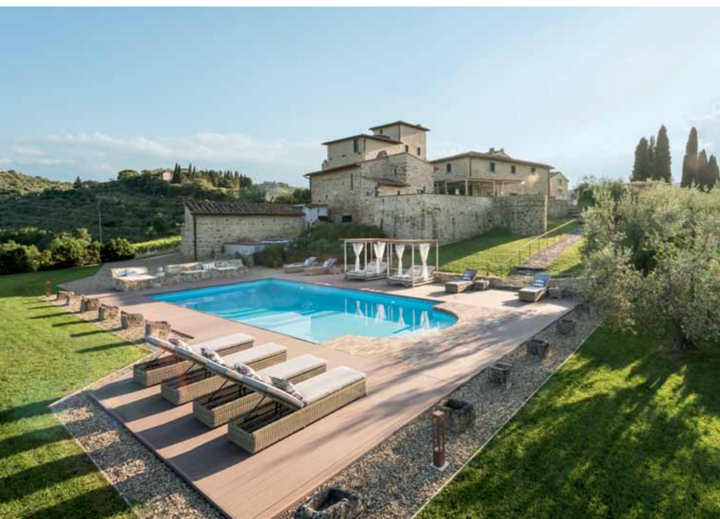
Vom Vitigliano aus genießt man einen Panoramablick in die Bilderbuchlandschaft des Chianti mit seinen geschwungenen Hügeln und Wäldern.

Maximal vierzehn Gäste kommen in diesen Genuss, gleichzeitig auf Vitigliano verweilen zu können. Logiert wird in nur sieben exklusiven Suiten, die die Hausherrin persönlich mit großer Geschmackssicherheit und viel Liebe bis zum letzten Detail eingerichtet hat. Jede davon besticht durch ihren großzügigen, jedoch individuellen Grundriss, der durch die historischen Mauern vorgegeben wird. Verbindende Elemente sind die Highend-Boxspringbetten, die wertvollen Perserteppiche aus dem Privatbesitz der Gastgeberin sowie eigens für Vitigliano gefertigte Deckenlampen. Ansonsten wurde jede Suite mit einer gelungenen Mischung aus Antiquitäten, Tischlereinbauten, Reproduktionen und modernen Elementen stilvoll eingerichtet. Jede Unterkunft bietet ihren Bewohnern zudem eine fantastische Aussicht auf das