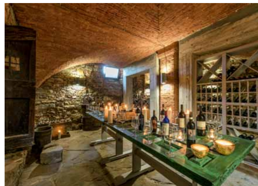
Der original restaurierte Weinkeller im Gewölbe unter dem Turmhaus bietet eine beeindruckende Atmosphäre für Weinproben und Gespräche über die Weine der Toskana.

„Ich liebe die kleine Kapelle, sie ist mein persönlicher Kraftplatz auf Vitigliano, mein Rückzugsort“, verrät die charmante Deutsche. Ein Urlaubstag bei Marion Hattemer beginnt mit einem servierten, nach individuellen Wünschen des Gastes zusammengestellten Frühstück. Man sitzt unter der großen Pergola am Haus mit Traumblick hinauf zum Monte San Michele, dem mit 892 Metern höchsten Berg des Chianti, und lässt es sich gutgehen. Wer seine Zeit auf dem Anwesen verbringt, wird über Tag mit allem versorgt, was das Herz begehrt. Wenn die Hitze des Tages angenehmeren Temperaturen weicht, trumpft der Koch von Vitigliano mit seiner vollendeten Kochkunst auf. Die Gäste sind unter sich, genießen vor spektakulär untergehender Sonne ein mediterranes Vier-Gänge-Menü aus frischen, wenn möglich biologischen Zutaten aus der Region. Dazu reicht die Gastgeberin einen ihrer edlen Tropfen aus dem gut gefüllten Keller, der Domäne des Hausherrn. Kiyan ist Weinliebhaber und profunder Experte für die besten Tropfen, nicht nur die italienischen. Eigentlich möchte man dieses Refugium gar nicht verlassen, aber Florenz ist nur gut eine Stunde entfernt, der pittoreske Marktplatz von Greve lädt zum Verweilen ein, und natürlich hat die Gastgeberin viele Geheimtipps für entdeckungsfreudige Gäste. Der Besuch eines der zahlreichen umliegenden Weingüter ist fast Pflicht, vielleicht bei einem der prominentesten Winzer der Gegend: In der Tenuta Degli Dei produziert Tommaso Cavalli, Sohn des Mode-