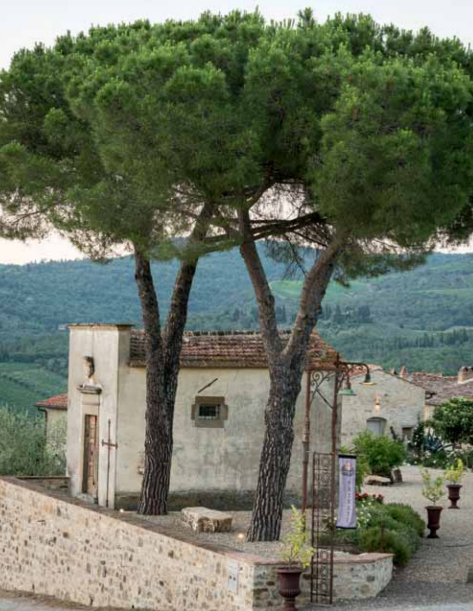
Die historische San Pietro Martir-Kapelle für die persönliche Traumhochzeit.

liche Vertiefungen auf. „Dort wurden einst die Messer gewetzt; für mich ist das lebendiger Geschichtsunterricht“, sagt sie.