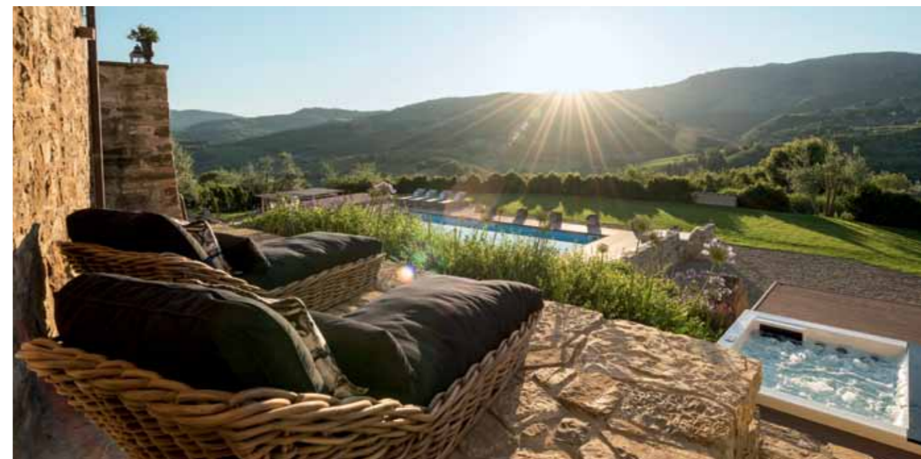
Nach dem Hamam-Besuch oder einer entspannten Runde im sprudelnden Whirlpool relaxt man auf der Sonnenempore am Haus – Postkartenidylle inklusive.