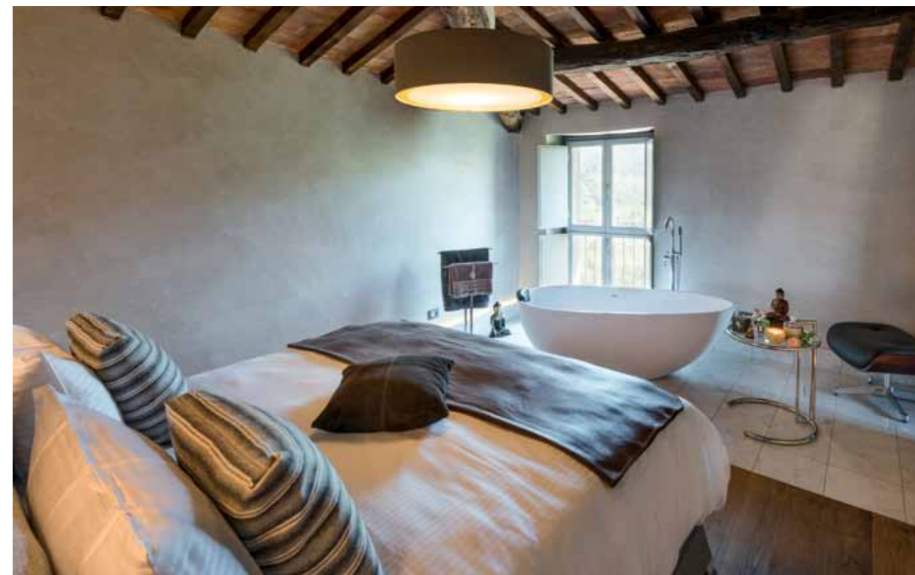
Im zweiten Stock der Turm-Villa befindet sich die große „Panzano“-Suite mit frei stehender Badewanne im Schlafzimmer, einem separaten Wohnzimmer und Bad mit XL-Dusche.

von Weinbergen und Olivenhainen umgebene Anwesen und die umliegende liebe Kulturlandschaft des Chianti.